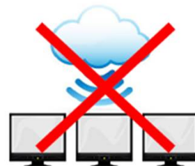
一般のクラウドサービス